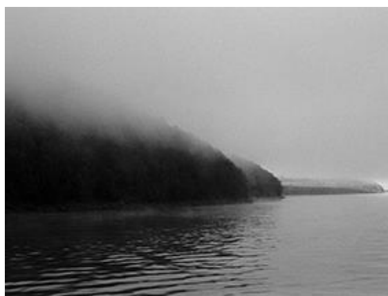
Le fleuve Amour près de Blagovechtchensk, 1997