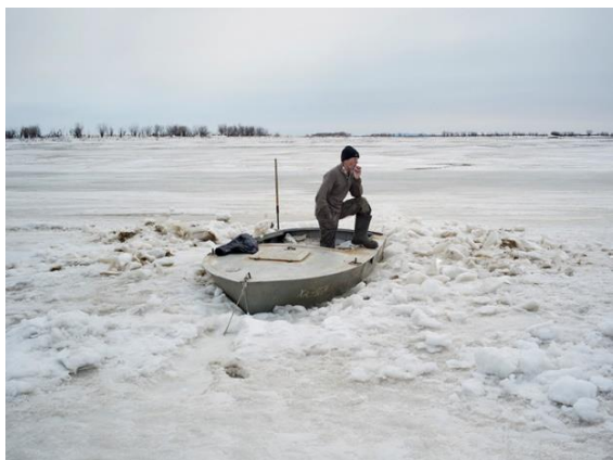
Le fleuve Amour à Nergen, 2018