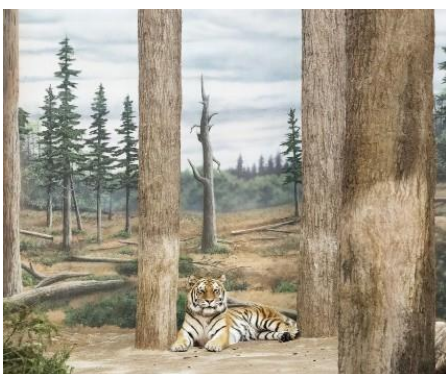
In Situ - Etats-Unis