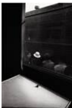
Divagation sur les pas de Bashô

Création visuelle : Marion Guillon Romet