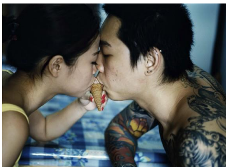
Les classes moyennes à Singapour, Kuala Lumpur et Bangkok