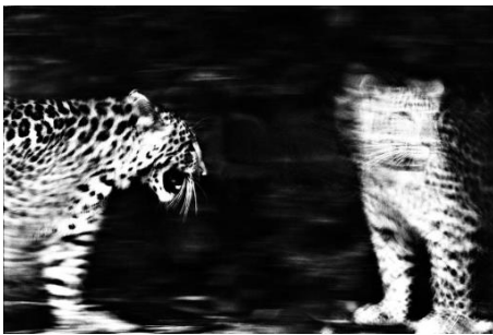
anima © Jean-François Spricigo, 2009