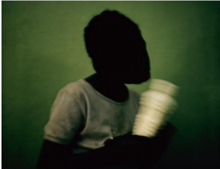
L'ombre de l'enfance