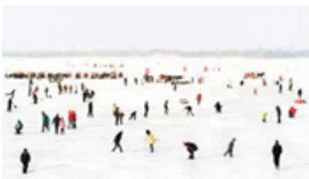
Conte d'hiver, conte d'été