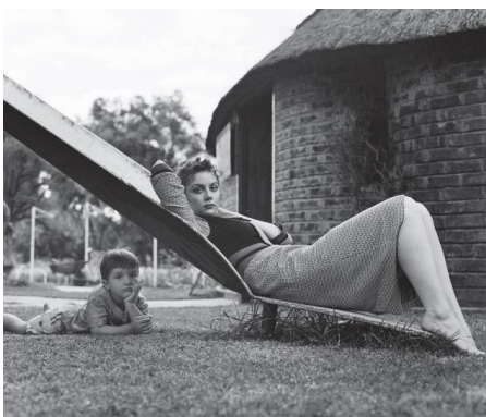
Les Blancs Africains, voyage au pays natal