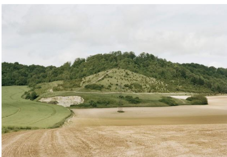
Campagne française, fragments © Thibaut Cuisset, 2010